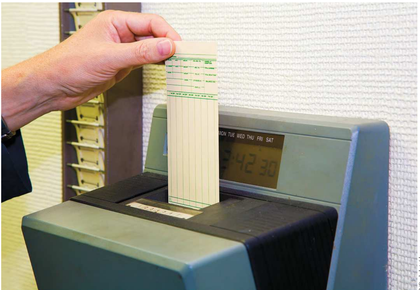
Auch Arbeitszeitautonomie ist ein Kriterium für die Wahl des richtigen Arbeitsvertrags.

Alternativ zur Gleitzeit kann das klassische Modell der fix vorgegebenen Arbeitszeiten (z.B. Mo-Fr 9-17 Uhr) vereinbart werden. In diesem Fall fallen Mehr- bzw. Überstunden grundsätzlich mit dem Überschreiten der vereinbarten Normalarbeitszeit an.