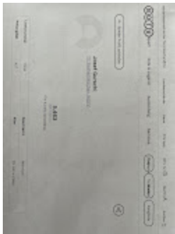
Gurschl - Statuts 31.08..jpg 78K