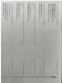
Pekar - Status vor 31.08..jpg 92K